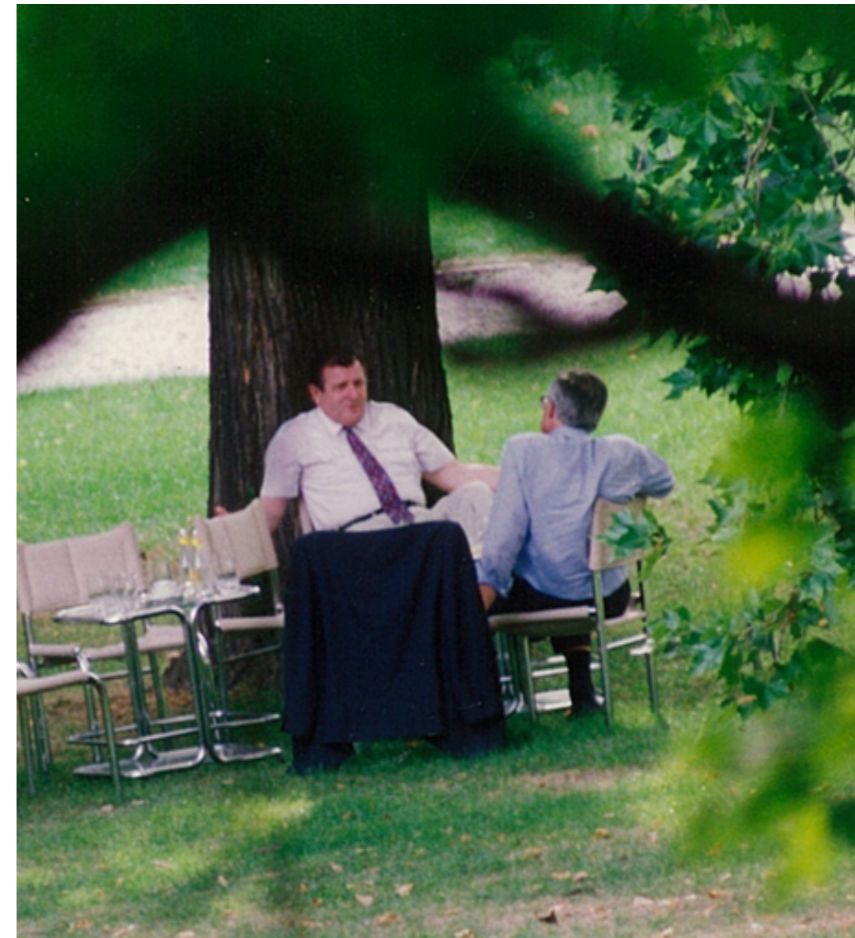
Na snímku brněnského fotografa Jefa Kratochvíla z 26.8.1992 jedná Václav Klaus a Vladimír Mečiar ve vile Tugendhat o rozdělení Československa.